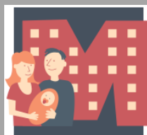
Budynek objęty programem M d M